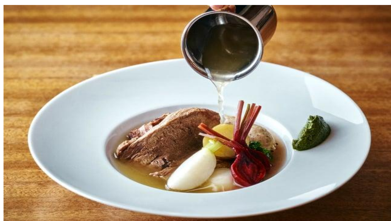
bollito misto salsa verde ボッリートミスト サルサヴェルデ