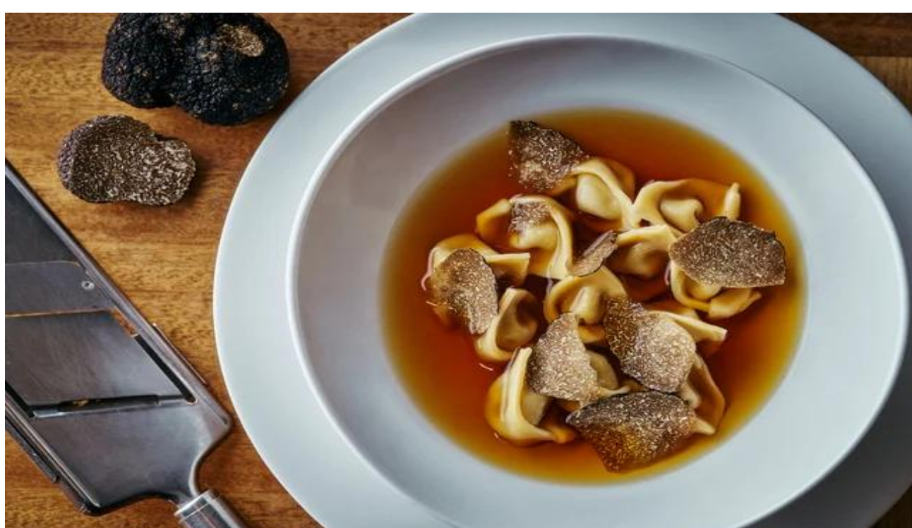
tortellini al brodo black truffle トルテリーニ イン ブロード 黒トリュフ添え