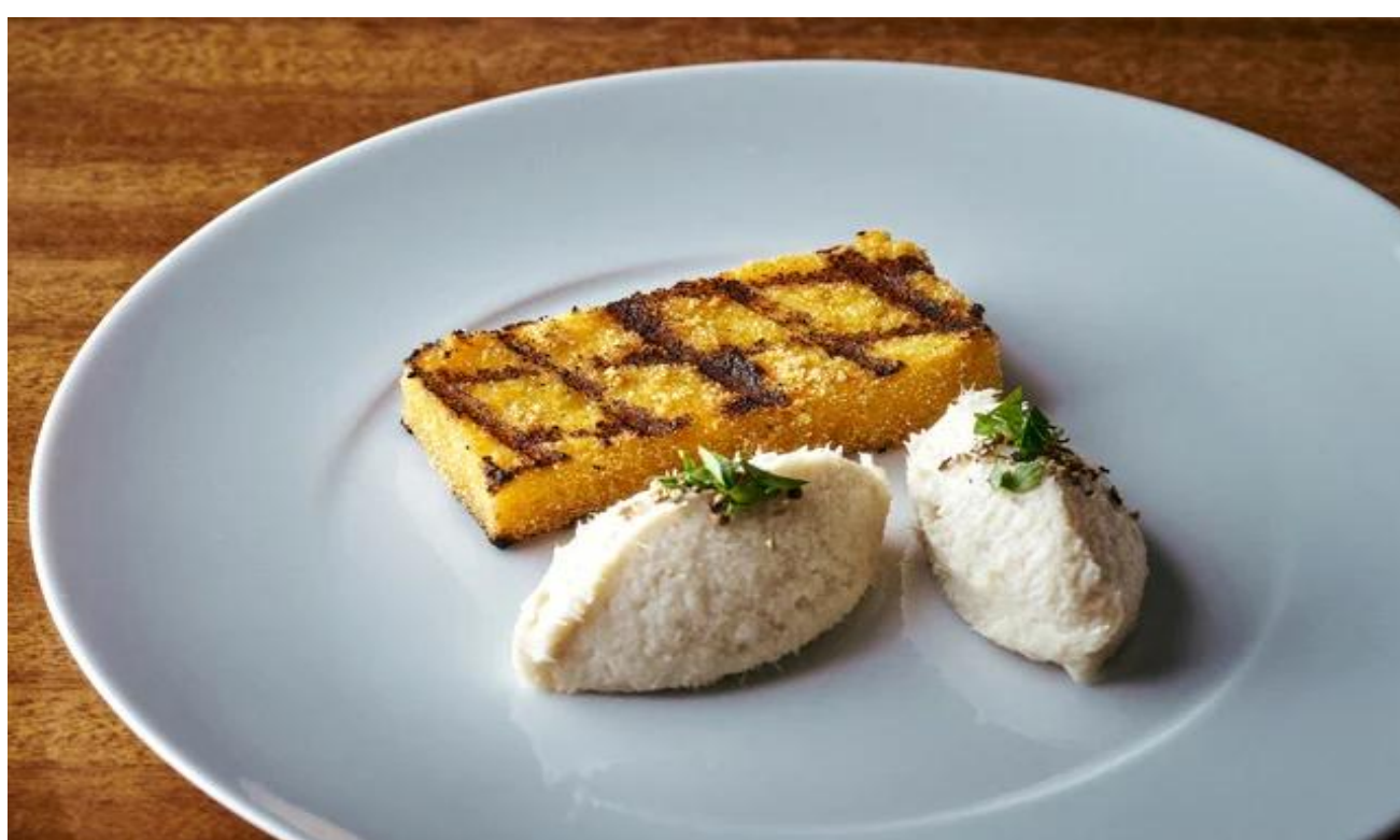
baccala montecato, grilled polenta バッカラマンテカート グリルポレンタ添え